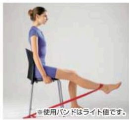
※使用バンドはライト値です。