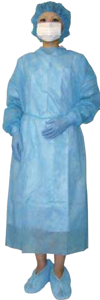
FR-330 シリーズ イメージ