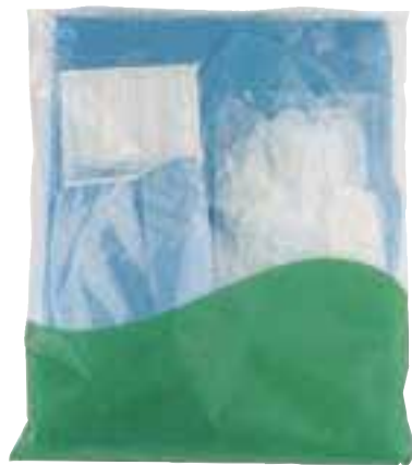
◆ 「FR-330シリーズ」イメージ (不織布ガウン入り)