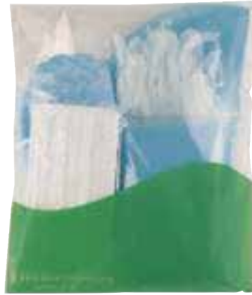
◆ 「FR-350シリーズ」イメージ (ポリエチレングアウン入り)