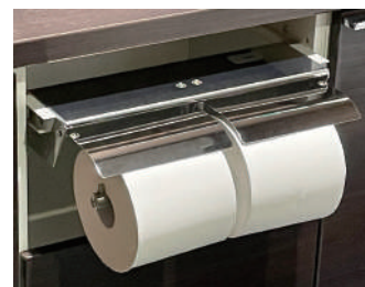
使用イメージ(ホルダー別途)