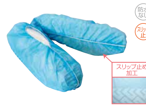
スリッパ止め加工