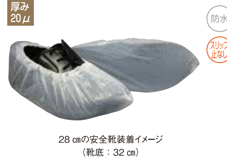
28cmの安全靴装着イメージ (靴底：32cm)