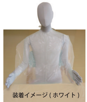
装着イメージ(ホワイト)