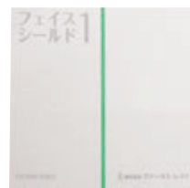
梱包単位: 12箱/ケース