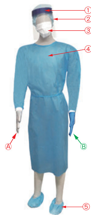
上記ガウンはFR-204の着用時イメージ