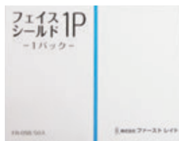
梱包単位: 12箱/ケース